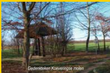
Gedenkteken Koeveringse molen