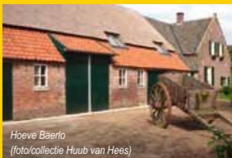
Hoeve Baerlo