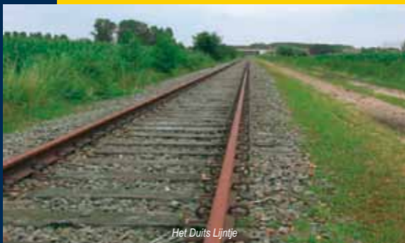
Het Duits Lijntje

Het Duits Lijntje is een wat hoger in het landschap gelegen (op een zandbed) spoorlijn. De spoorlijn stamt uit 1878. In die tijd was het Duits Lijntje, van Boxtel tot Wesel in Duitsland, een onderdeel van de snelste spoorverbinding tussen Londen, Berlijn en St. Petersburg. Vanaf 1881 reden hier internationale sneltreinen waarmee je zonder overstappen tussen Vlissingen en Berlijn kon reizen. Daarom reisden veel vorsten, de Russische Tsarenfamilie en diplomaten via het Duits Lijntje. In 1925 stopte de Noord-Brabantsch-Duitse Spoorweg-Maatschappij op dit traject met personenvervoer. De concurrentie was te groot. Aan het einde van de Tweede Wereldoorlog werd de spoorbrug bij Wesel door de terugtrekkende Duitse Wehrmacht opgeblazen. Dit was het einde voor het Duitse gedeelte van de spoorlijn. Later werd ook de rest van het lijntje deel voor deel gesloten. In 2004 stopte de NS met het goederenvervoer op het laatste traject (Veghel - Boxtel).