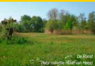
De Roost

Door veranderde inzichten werden later beheersmaatregelen getroffen om de oorspronkelijke natuur en kenmerken in het gebied te herstellen. In de huidige staat is De Roost een broekbos met veel wilgen en veenmoeras, omzoomd door verschillende natte stukjes grasland.