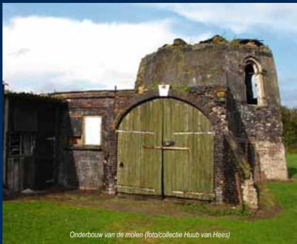
Onderbouw van de molen

Grenzend aan de molen bevindt zich een eenvoudig opslaggebouw waar de producten werden opgeslagen. Met een vlucht van slechts 18,70 meter staat de molen ook wel bekend als Nederlands kleinste bergkorenmolen.