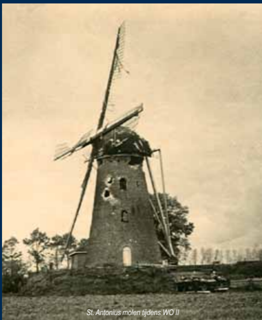
St. Antonius molen tijdens WO II