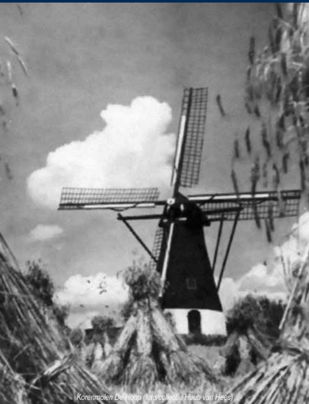
Korenmolen De Hoop

Noord-Brabant kende vanaf de Franse tijd een drietal periodes van molenbouw. In de derde periode (1890-1910) werd opmerkelijk vaak gebruik gemaakt van het grote aanbod aan goedkoop afbraakmateriaal, afkomstig uit de noordelijke provincies. Het is kenmerkend voor het einde van de 19e, begin 20e eeuw, dat Noordoostelijk van de Zuid-Willemsvaart, met een concentratie tussen Schijndel en Helmond, voornamelijk achtkante molens werden gebouwd. De Keldonkse molen is hiervan een vertegenwoordiger.